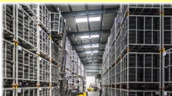
倉庫に排気ファンがなく、熱が溜まりやすい・・・