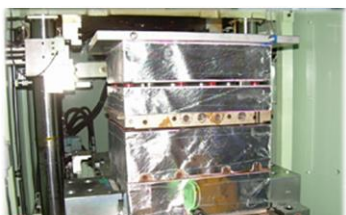
成型機のヒーターが暑い・・・