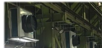
工場内で換気ができてなくて暑い・・・