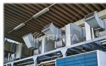
空調機を入れたいがどの方式がいいか悩んでいる・・・