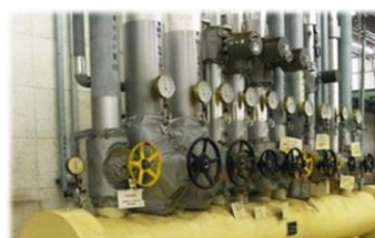
ボイラーの蒸気配管が断熱できていない・・・