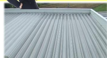
折板屋根から熱が入ってきて暑い・・・