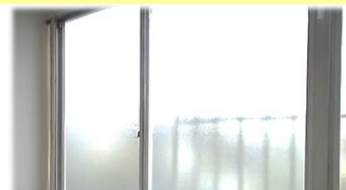
窓から熱が入ってきて、暑い・・・！