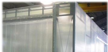
間仕切りして、局所排気を設置したい！