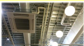
天井が低いため作業員が熱を感じやすい・・・