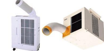
スポットエアコンを置いて暑い・・・