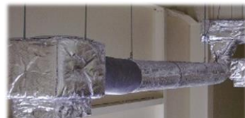
全体空調ではなく、部分的に冷やしたい！