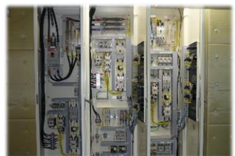
分電盤の漏電対策