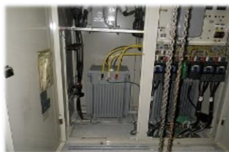
変圧器の増設・集約したい