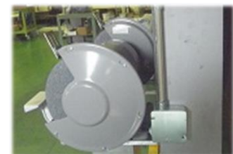
コンセントを増やしたい