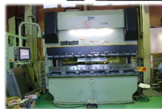
新たに機械を入れる