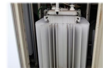
トランスオイルのPCB検査