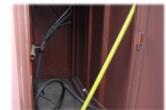
高圧ケーブルを交換したい