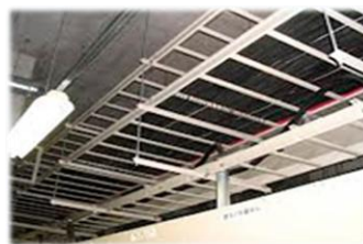
配線をサイズアップしたい