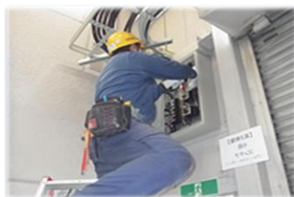
ブレーカーの増設・減設をしたい