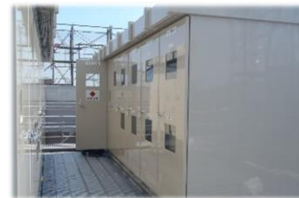
キュービクルの増設を行いたい