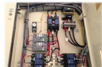
コンセント位置の変更