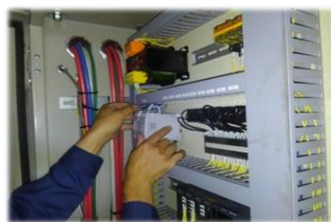
電源容量が足りてない